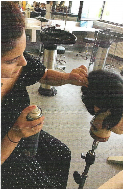
Die Haare werden gefärbt, geföhnt und die Frisuren gesteckt

Toten. Wir wollen euch die Looks nicht vorenthalten und zeigen euch, was die angehenden Friseure rund um das Thema „Sugar Skull“ gezaubert haben.