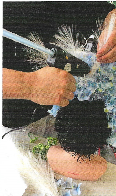
Der Kopfschmuck wird auf einem Haarreif erstellt